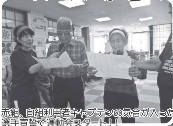
赤組、白組利用者キャプテンの気合が入った選手宣誓で運動会スタート!!