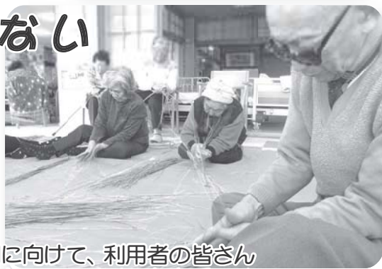
お正月に向けて、利用者の皆さんで縄をなっています。お上手です。