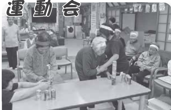
今度は缶積み競争、さあどっちが早いかな? さあ勝負!!