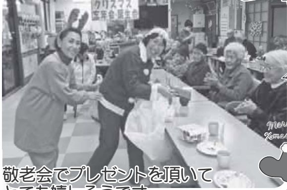
敬老会でプレゼントを頂いてとても嬉しそうです。