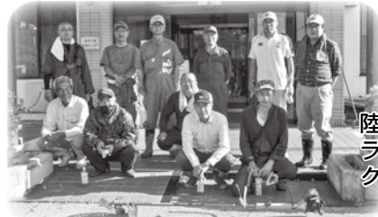
陸前高田 ライオンズ クラブ様