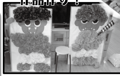
節分の兔を作りました(＃^．＃)