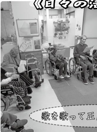
歌を歌って正月を祝いました